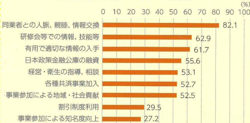
組合加入で受けた便益・メリット (生衛業計)

「同業者との人脈形成、情報交換等ができた」は全体の82%、「研修会等参加で情報・知識、技術・技能の習得ができた」は63%、「組合事業参加で地域・社会貢献ができた」は53%。 あなたは組合に何を期待しますか？